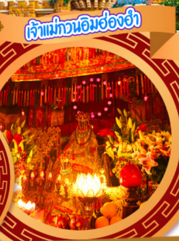
เจ้าแม่ทวนอิมฮ่องกง

05-08, 17-20 ต.ค., 31 ต.ค.-03 พ.ย.67 02-05, 07-10, 14-17, 16-19 พ.ย.67 21-24 พ.ย., 28 พ.ย.-01 ธ.ค.67