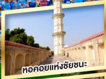
หอคอยแห่งชัยชนะ