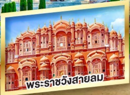
พระราชวังสีชมพู