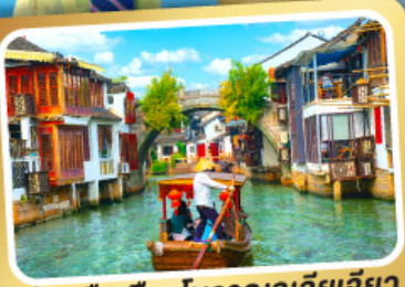
ล่องเรือเมืองโบราณซูเจียเจียว