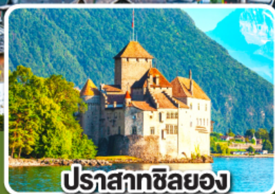
ปราสาทชิลยอง