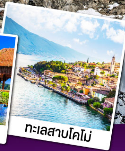
ทะเลสาบโคโม