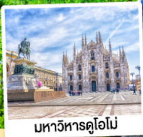
มหาวิหารดูโอโม