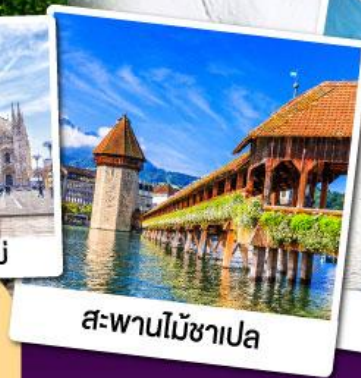
สะพานไม้ชาเปล