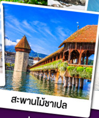
สะพานไม้ชาเปล