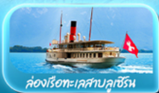
ล่องเรือทะเลสาบลูเซิร์น

ซูริก โลซาน เวเวย์ เซอร์แมท ลูเซิร์น ริก