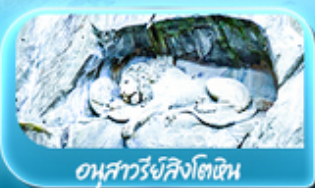
อนุสาวรีย์สิงโตหิน