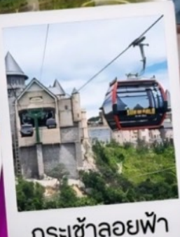
กระเช้าลอยฟ้า

แพคเกจ ครบ ทุกจุดเช็คอิน สุดฮิต ที่พัก 2 คืน ห้องละ 2 ท่าน พิกดานัง 1 คืน / พิกบานาฮิลล์ 1 คืน ไกด์ออนไลน์ ( ให้ความช่วยเหลือผ่านโทรศัพท์ )