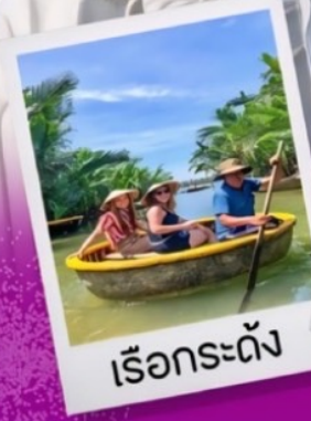
เรือกระด้ง