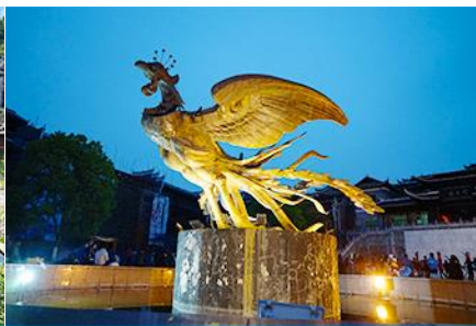
เมืองโบราณฟงหวง