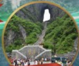
กำแพงประตูสวรรค์