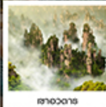
จางเจียเจีย