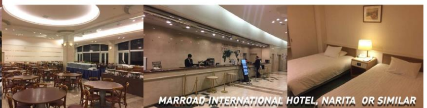
MARROAD INTERNATIONAL HOTEL, NARITA OR SIMILAR