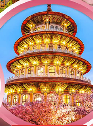
วัดจู้เทียนหยวน

ช้อปปิ้งจุใจ ย่านซีเหมินติง ตลาดไทจงไนท์มาร์เก็ต อิ่มอร่อยกับ...เมนูปลาประดาน้ำดิบดี ซาซิมูฟุฟต์สไตล์ไต้หวัน เสี่ยวหลงเปา