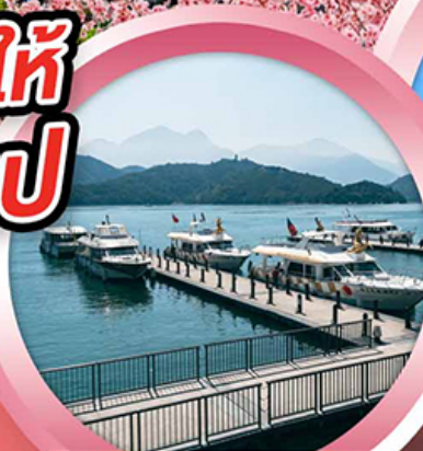
ล่องเรือทะเลสาบสุยอันจินทรา