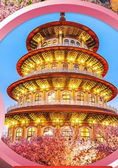
วัดจู้เทียนหยวน

ช้อปปิ้งจุใจ ย่านซีเหมินติง ตลาดไทจงไนท์มาร์เก็ต อัมม่อร้อยกับ..เมนูปลาประธนาธิบดี ชาบูบุฟเฟ่ต์สไตล์ไต้หวัน เสียวหลงเปา