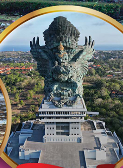
สวนวิษณุ