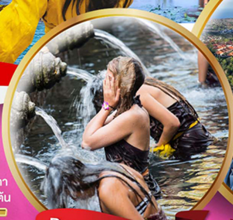
Pura Tirta Empul