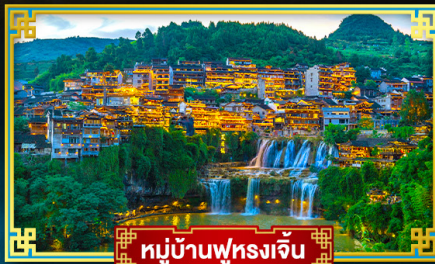
หมู่บ้านฟุหลงเจิน