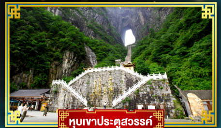
อุทยานประตูสวรรค์