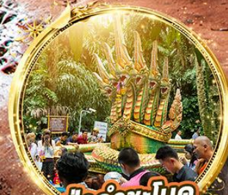
ปากำชะโนด