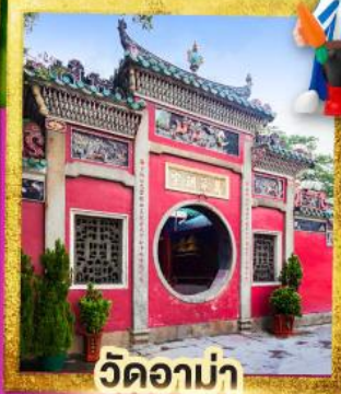
วัดอาบ่า