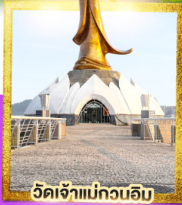
วัดเจ้าแม่กวนอิม