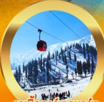
เคเบิลคาร์ กุลมาร์ค