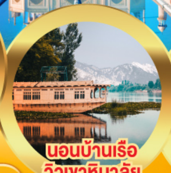
นอนบ้านเรือ วิวเขาหิมาลัย