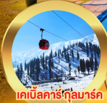
เคเบิลคาร์กุลมาร์ค