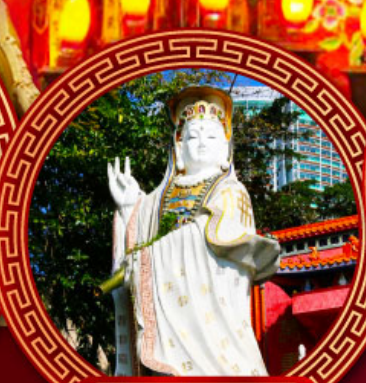
เจ้าแม่กวนอิม รัฟัสเบย์