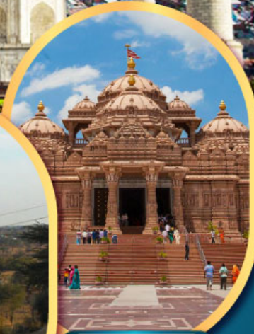
วิหารอักขารค์คัม