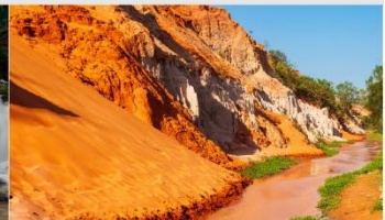
ลำธารนางฟ้า

*ทางบริษัทฯ ขอสงวนสิทธิ์ในการสลับโปรแกรมทัวร์ตามความเหมาะสมขึ้นอยู่กับสถานการณ์หน้างาน โดยคำนึงถึงผลประโยชน์ของลูกค้าเป็นสำคัญ