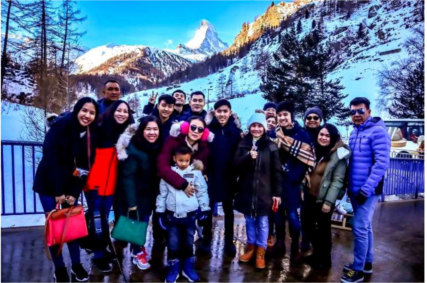
ยุโรปตะวันออก 9วัน TG DELUXE พัก Hallstatt เดินทางปีนัม 29ธ.ค.-06ม.ค.2562(จำนวน28ท่าน)