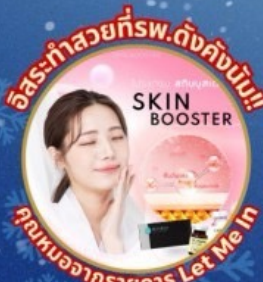
อิสระ-ทำสวยที่รพ.ดังคั้งนับ!!! บริการนวดจากนวดการ Let me in

ชมจอ LED ขนาดยักษ์ที่รีสอร์ท 5 ดาว สักการะวัดจอนดิงชา วัดโบมุนชา วัดชุกุกชาวัดทองที่ใหญ่ที่สุดในเอเชีย วัดซัมซอนชา วัดพงอินชา พระพุทธรูปขนาดใหญ่ของโซล ชมพระราชวังคยองบกคุง ห้องสมุดสุดอลังการ อิสระ-ช้อปปิ้ง Lotte Duty Free