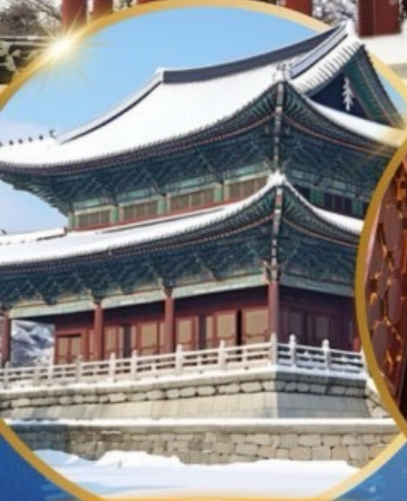
พระราชวังเคียงบกทุก