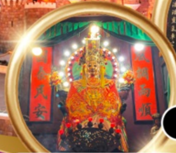
ขอพรซื้อขายอสังหาริมทรัพย์