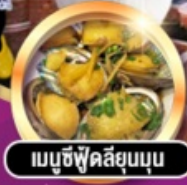
เมามูซีฟู๊ดสิ่ยมูนูน