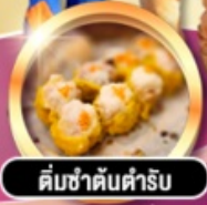
ติ่มซำต้นตำรับ