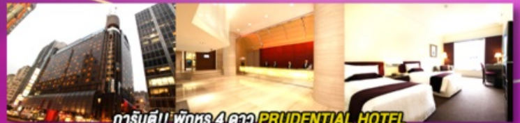
ทาร์นตี!! พักหรู 4 ดาว PRUDENTIAL HOTEL ติดถนนนาราน ย่านช้อปปิ้งจิมซาจู้