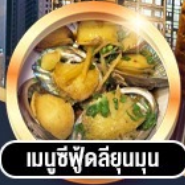
เมนูซีฟู้ดพรีเมียม