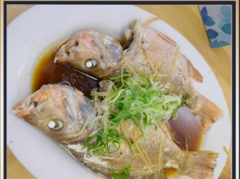
ปลาหนึ่งซีอิ้ว