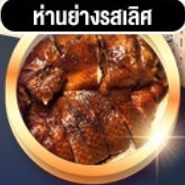
ห่านย่างสไลด์