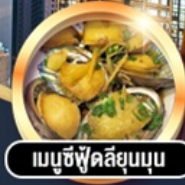
เมนูซีฟู้ดลิ้นจี่นูนูน