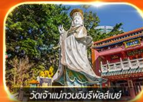
วัดเจ้าแม่กวนอิมรafflesia

รวมตั๋วดิสนีย์แลนด์+รถรับ-ส่ง ซอบบิ้งแบบจัดเต็ม พักย่านจิมซาจุ่ย นั่งรถราง PEAK TRAM, ชมวิวอ่าววิคตอเรีย, วัดหลิมฟ้า, วัดหวังต้าเซียน, วัดกวนไท, วัดอองซ่า, วัดแชกงหมิว