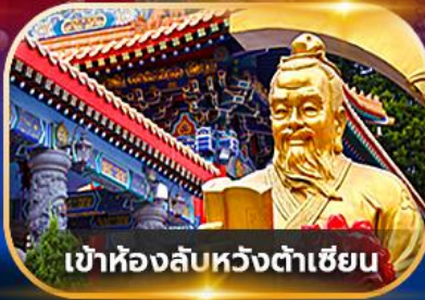
เข้าห้องลับหวังต้าเซียน