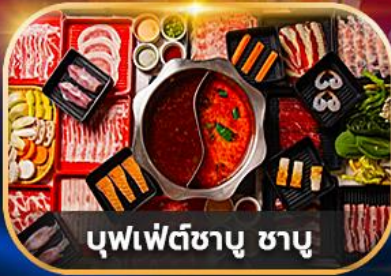
บุฟเฟ่ต์ซาบู ซาบู