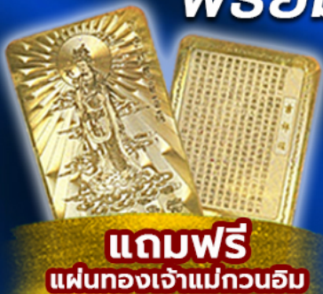
แถมฟรี แผ่นทองเจ้าแม่กวนอิม