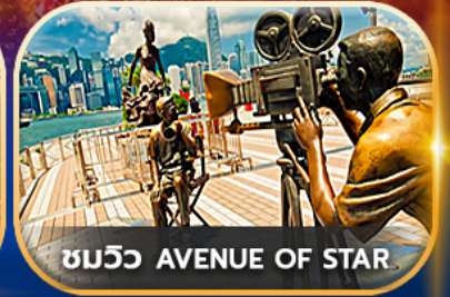
ชมวิว AVENUE OF STAR