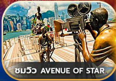
ชมวิว AVENUE OF STAR