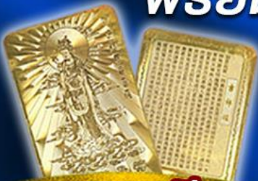
แถมฟรี แผ่นทองเจ้าแม่กวนอิม