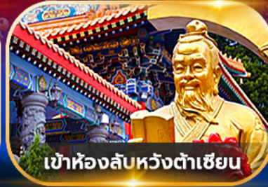
เข้าห้องลับหวังต้าเซียน