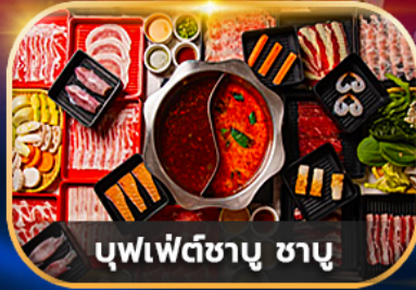
บุฟเฟ่ต์ซาบู ซาบู