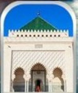
MOHAMMED V SQUARE