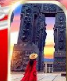
THE CHRONICLE OF GEORGIA