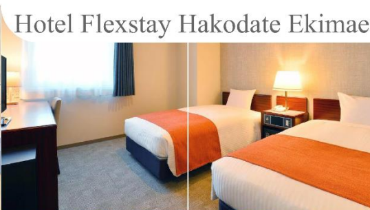
Hotel Flexstay Hakodate Ekimae