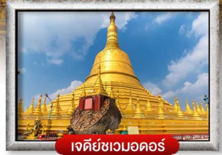
เจดีย์ชเวดากอง

เมนู สุดพิเศษ | กุ้งแม่น้ำเผา + บุฟเฟ่ต์นานาชาติ