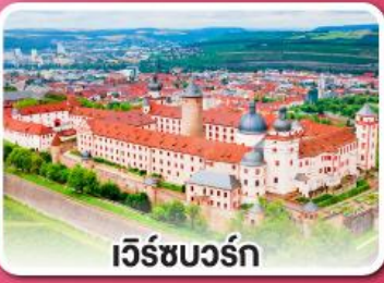
เว็ร์ชบวร์ค