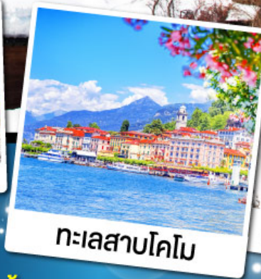
ทะเลสาบโคโม