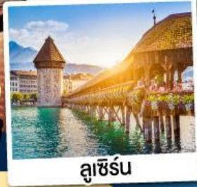
ลูเซิร์น

ณ เมืองอุคเคอร์แบค เมืองแห่งน้ำแร่สวิตเซอร์แลนด์