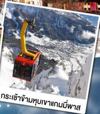
กระเช้าข้ามหุบเขาแกมมีพาส

18-24 ก.พ. 68 11-17 มี.ค. 68 29 เม.ย.-05 พ.ค. 68