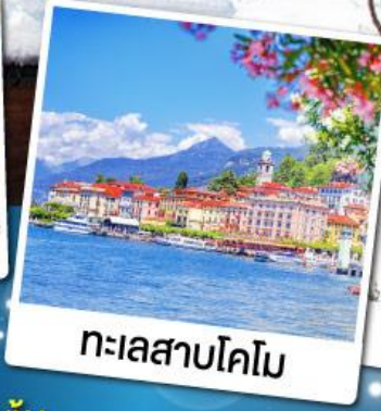
ทะเลสาบโคโม