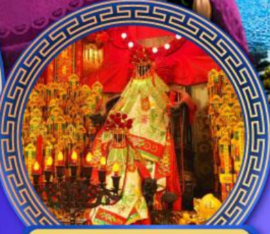
เจ้าแม่กวนอิมฮ่องกง