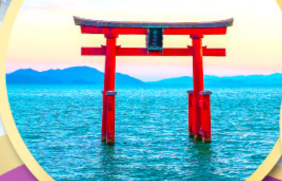
เสาโทริอิ