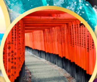
ศาลเจ้าฟูชิมิอินาริ