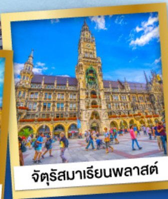
จัตุรัสมาเรียนพลาสต์