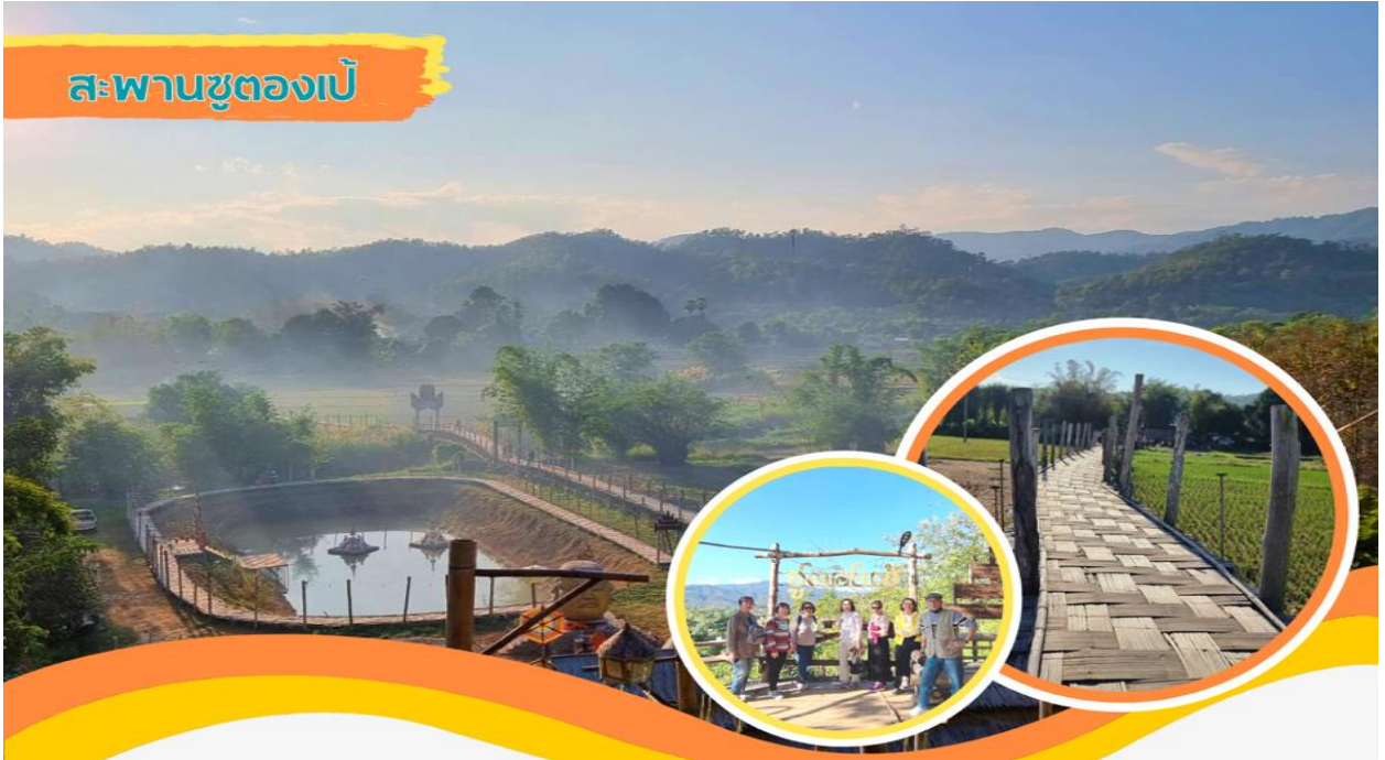
สะพานชุตองเป็

ร่วมใจของพระภิกษุสงฆ์และชาวบ้านทุ่งไม้สักที่ต่างก็ช่วยกันลงแรงสานพื้นสะพานด้วยไม้ไผ่ทอดยาวข้ามผ่านทุ่งนา และแม่น้ำสายเล็ก ๆ เพื่อให้พระภิกษุสงฆ์และชาวบ้านที่อยู่อีกฝั่งได้ใช้สัญจรไปมาระหว่างหมู่บ้าน