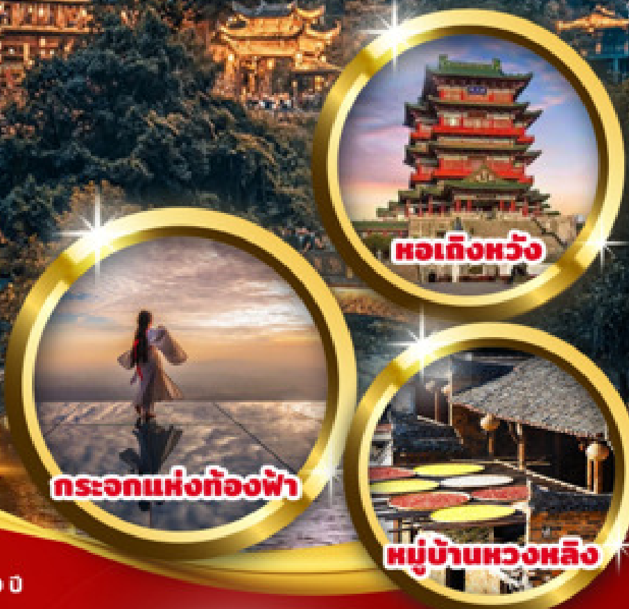
หอเกิ่งหวัง