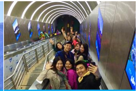
บันไดเลื่อนทะเลภูเขา

วันที่ 1 เมืองโบราณผู่หลงเจิ้น – ศูนย์ผลิตภัณฑ์ที่ย่างพารา – กระเช้าขึ้นเขาเทียนเหมินซาน – ระเบียบแก้ว เลียบหน้าผา – บันไดเลื่อนทะเลภูเขา – (เลือกซื้อโปรแกรม ออฟชั่น โชว์จิ้งจอกขาว)