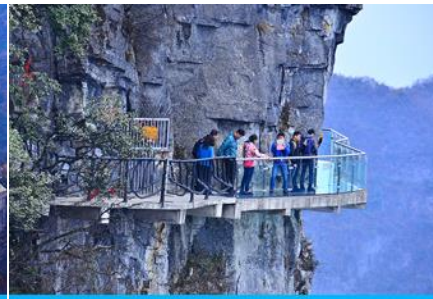
หน้าพลาวยี่ฟ้าทางเดินกระจก