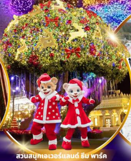
สวนสนุกเอเวอร์แลนด์ ฮิม พาร์ค