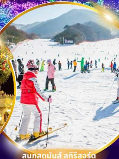
สกีรีสอร์ท

ชมจอ LED ขนาดยักษ์ที่รีสอร์ท 5 ดาว ใหญ่ที่สุดในเอเชียเหนือ สัมปัสหิมะสกีรีสอร์ท สนุกสุดมันส์ สวนสนุกเอเวอร์แลนด์ ชมพระราชวังคยองบกคุง ย้อนอดีตหมู่บ้านบุคซอน อันอก อิสระช้อปปิ้งคังนัม Lotte Duty Free