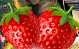
มีผลตอบเอบอจึสุด ๆ จากรั้