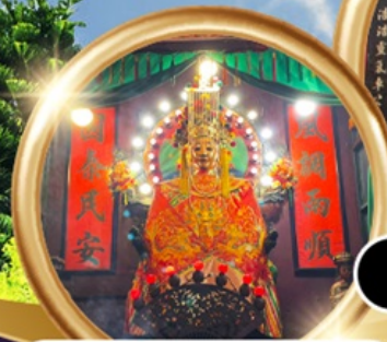
ขอพรซื้อขายสังหาริมทรัพย์