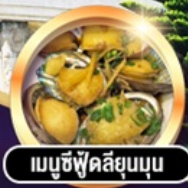
เมนูซีฟู้ดลิ้นมดุน