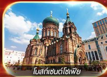
โบสถ์เซนต์โซเฟีย