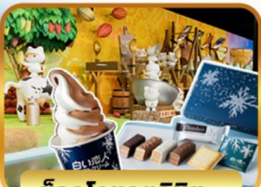
ช็อกโกแลตชิช: