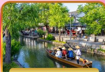
เบตอบุร์กษุราชิกิ