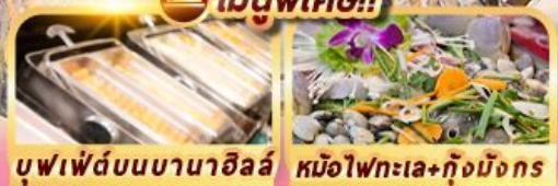
บุฟเฟ่ต์บนบานาฮิลล์ หม้อไฟทะเล+กุ้งมังกร