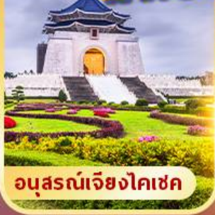
อนุสรณ์เจียงไคเช็ค