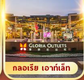
กลอเรีย เอาท์เล็ต