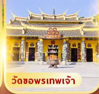
วัดขอพรเทพเจ้า