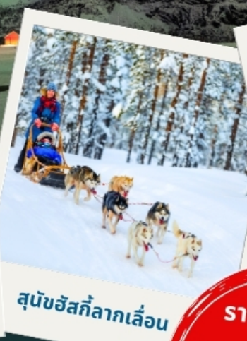
สุนัขฮัสกีลากเลื่อน