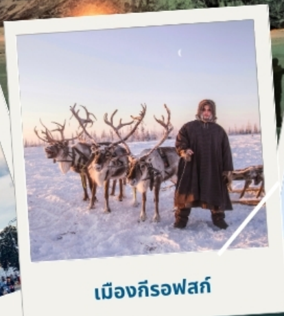
เมืองก็รอฟสค์