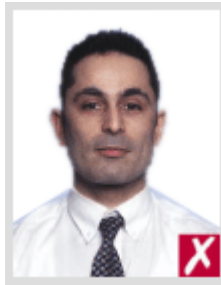
ใกล้เกินไป