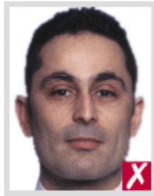
ใกล้เกินไป