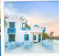
ซานตารีนาคาเฟ่